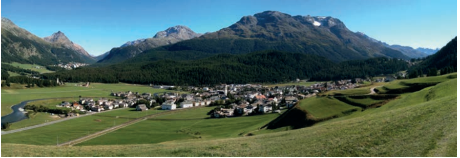
Wikimedia Commons · Xenos