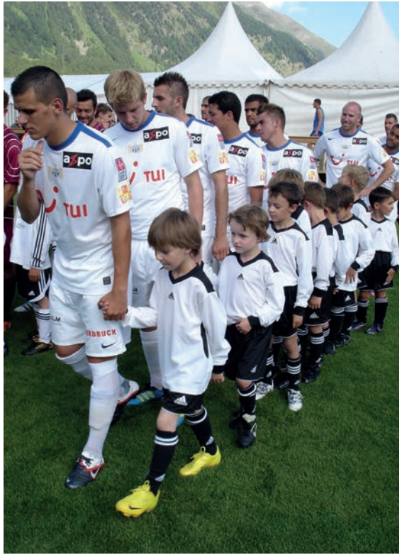
FCZ im 2011