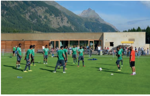
Al Ahli Jeddah Trainingslager